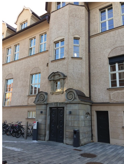
Eingang in die Adam-Kuckhoff-Str. 35 ( https://www.slavistik.uni-halle.de/ifatue/ )

Seit 2015 ist die hallesche Slavistik im Obergeschoss der Adam-Kuckhoff-Str. 35 zu Hause; die ersten beiden Stockwerke beherbergen die Anglistik und Amerikanistik. Der ästhetisch ansprechende Bau wurde kurz vor dem ersten Weltkrieg erbaut und gehörte ursprünglich zu den Agrarwis-